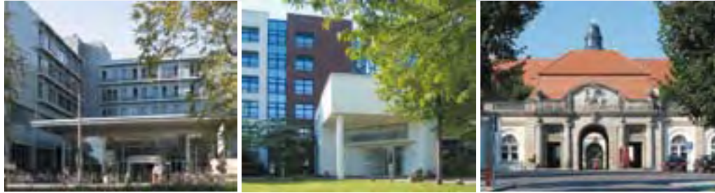
Das Universitätsklinikum Leipzig, das Herzzentrum Leipzig und das Klinikum St. Georg (v.l.)

Das jüngste Mitglied der Leipziger Kliniklandschaft ist das neu errichtete Herzzentrum, welches 1994 aus der Universität hervorgegangen ist. Hier wurde erstmals das Modell einer Verbindung von Krankenversorgung in privater Trägerschaft mit universitärer Forschung und Lehre unter öffentlicher Förderung/Kontrolle für die kardiovaskuläre Medizin erfolgreich umgesetzt.